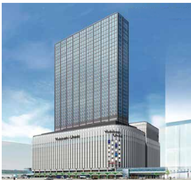
ヨドバシ梅田一体開発 計画建物（仮称）ヨドバシ梅田タワー 北側から望む 2019年秋竣工予定 (イメージパース *デザインは変更になる場合がございます)

引き続き、工事に当たっては、通行される歩行者やお客様の安全確保と周辺環境への十分な配慮を行ってまいりますので、皆様のご理解とご協力をお願いします。