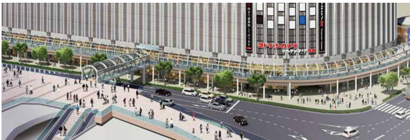
JR大阪駅 大阪ステーションシティ カリヨン広場と接続するAデッキおよび一部回遊デッキ