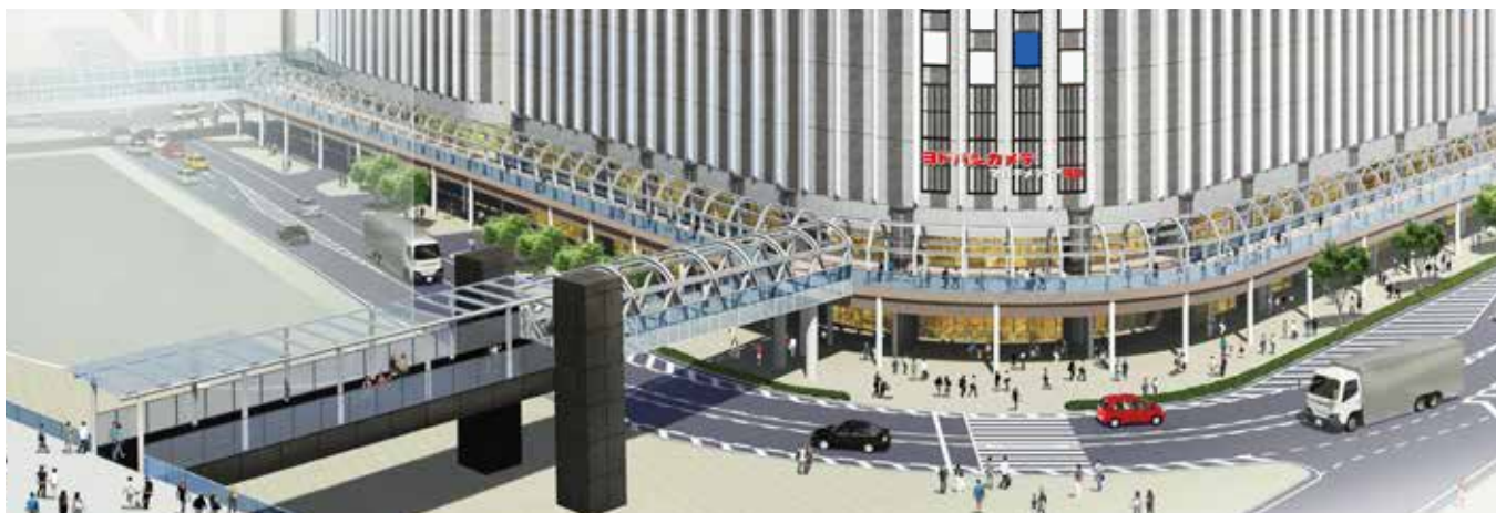
グランフロント大阪うめきた広場と接続するBデッキおよび一部回遊デッキ